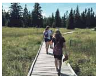
Výlet na Boží Dar