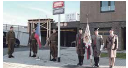
Ze slavnostního ceremoniálu pojmenování nové ulice ve Vysočanech

„Letos Místopisná komise hl. m. Prahy rozhodla o tom, že nové ulice v projektu Čvrť