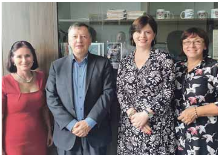
Ministr školství, mládeže a tělovýchovy prof. JUDr. Vladimír Balaš, CSc., s vedením Gymnázia Litoměřická

Poklidné prázdninové měsíce využilo vedení gymnázia k dokončení investičních akcí stavebního rázu (oplocení areálu školy nebo rekonstrukce kanalizačních rozvodů v části hlavní budovy) a k organizačnímu zajištění zahraničních studijních pobytů pro vybrané žáky. Díky tomu mohlo už 2. září odjet na týdenní poznávací jazykový zájezd do Liverpoolu 43 žáků vyššího gymnázia s pedagogickým doprovodem a o den později prvních šest žáků s profesorským doprovodem do Španělska na zimní trimestr v rámci projektu Erasmus+.