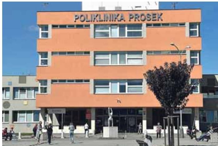
Na Poliklinice Prosek se opět očkuje proti covidu

Provozní doba očkovačích míst v říjnu: pondělí a čtvrtky od 8.00 do 15.00. red