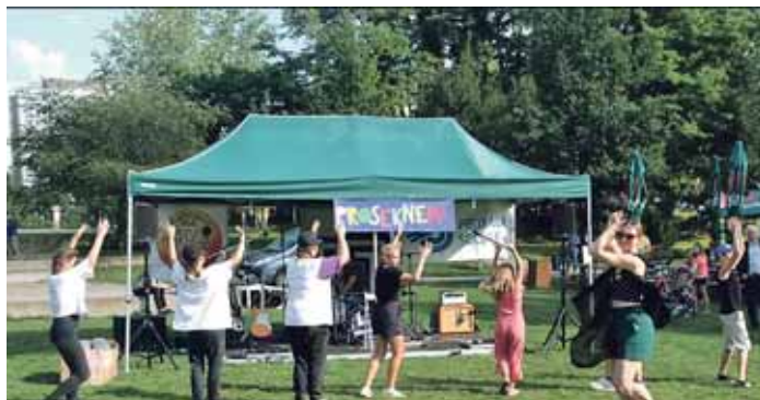
Poslední týden v srpnu v parku Přátelství patří již tradičně akci Prosekneme

Odpoledne 25. srpna 2022 byl pro všechny návštěvníky, zejména pro děti a jejich rodiče, připraven velmi pestrý program. Malí i velcí si mohli během odpoledne vyzkoušet svoji zručnost u žongléra, přihlásit se na turnaj ve fotbálku, z fotokoutku si odnést pěknou vzpomínku nebo ve výtvarné dílně popustit uzdu fantazii a vyzdobit si hrnečky a skleničky a svá umělecká díla si na památku odnést domů. Tradičně se „dveře netrhly“ v kadeřnickém salonu, kde šikovné kadeřnice zaměstnávaly především malé i velké slečny. Návštěvníci si také mohli jako upomínku na tento pěkný prázdninový den vyrobít vlastní odznak – placku