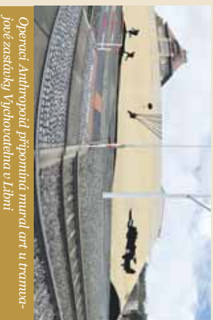
Operaci Antropoid připomíná mural art u tramvajové zastávky Vychovatelna v Libni

Heydrich útok sice přežil, ale nečistoty zanesené do ran vedly k sepsi. Zemřel o pár dní později 4. června. Nacisté v odvetě vyhladili obce Lidice a Ležáky a popravili mnoho odbojářů a lidí, kteří jim pomáhali. Mnoho z těch neaktivnějších se rekrutovalo z pražských čtvrtí Karlín, Libeň, Vysočany. To je i důvod, proč nové ulice ve Vysočanech připomínají právě tyto hrdiný protifašistického odboje. Kubiš s Gabčíkem a dalšími spolubojovníky zemřeli 18. června po boji, když se odmítli vzdát a opusit vyznačený úkryt v kryptě kostele svatých Cyrila a Metoděje v Praze 2.