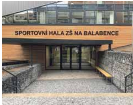
Nová sportovní hala v areálu ZŠ a MŠ Na Balabence je otevřena i veřejnosti

Otevření nové sportovní haly udělalo pomyslnou tečku za postupnou rekonstrukcí školního areálu ZŠ a MŠ Na Balabence, která začala už v roce 2018. „Nejprve jsme modernizovali školní kuchyň, následovala rekonstrukce