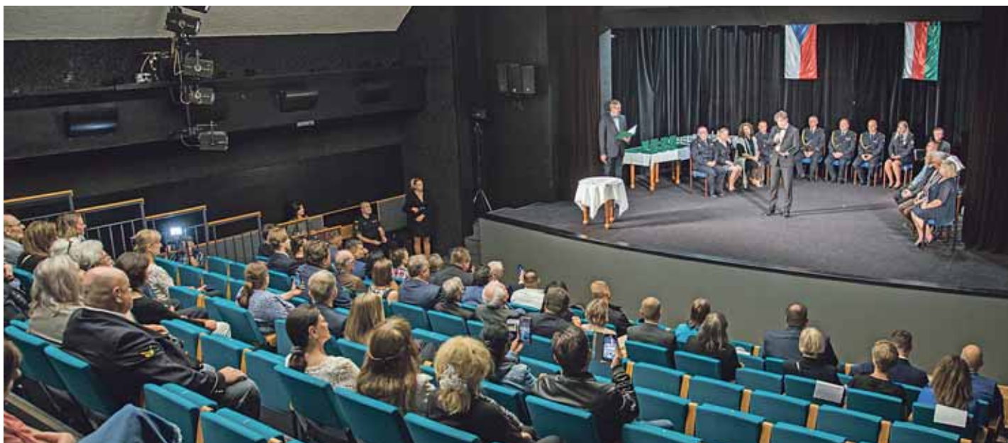
Ze slavnostního ceremoniálu v Divadle Gong, na němž byla předána ocenění vybraným občanům Prahy 9

Už podvanácté předal starosta městské části Praha 9 ocenění těm, kteří přispěli k dobrému jménu deváté městské části. Laureáty i letos navrhli sami obyvatelé devítky. Slavnostní ceremoniál se konal v Divadle Gong 8. září 2022, tedy v době, kdy si připomínáme vydání císařského dekretu, kterým byly Vysočany povýšeny na město.